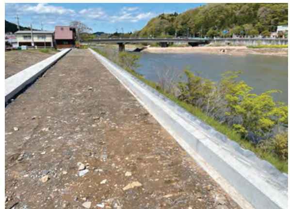
一級河川 久慈川堤防(太子町)