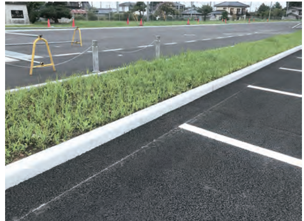
学校給食共同調理場駐車場(茨城町)